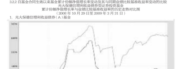
注: 1. 本基金合同于2009年10月29日生效, 截至2009年3月31日尚未完全建仓。

业绩比较基准: 光大保德信增利收益债券证券投资基金业绩比较基准为: 中证增利指数收益率(净值型) × 80% + 上证国债指数收益率(净值型) × 20%。